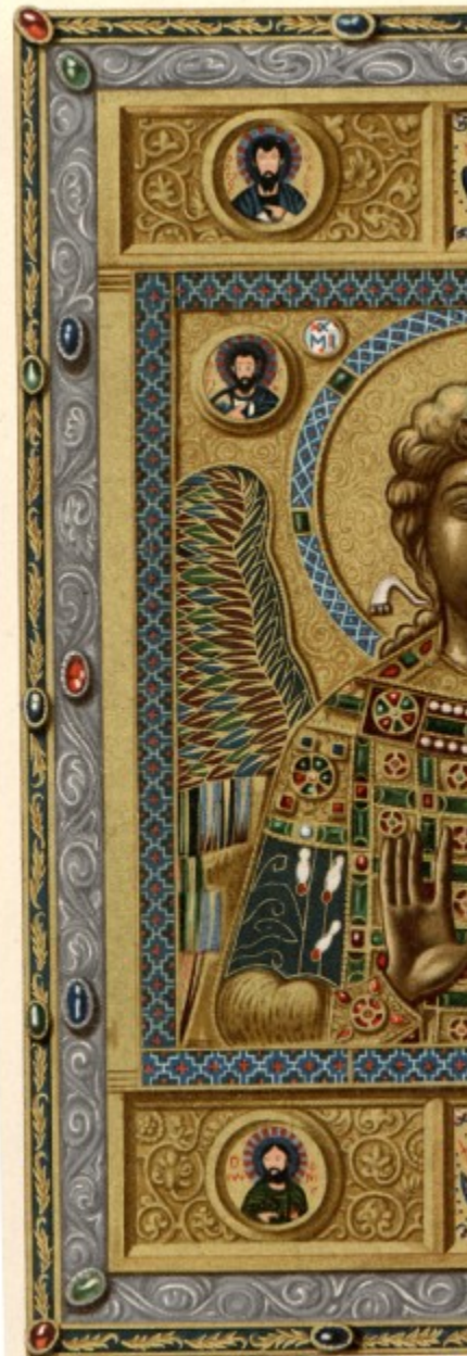
История и паметници

This is one of the mo with a leather cover and The author is the eminent and old technologies of in their natural colours a 52524