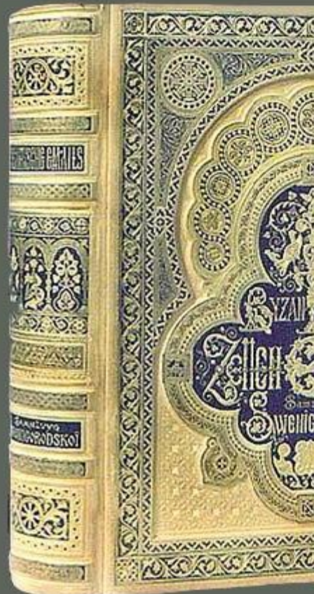
История и паметници на виз

Книгата е издадена в по 20 през февруари 1927 г., купена